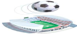
[ 월드컵경기장 70개 건축 가능 ]