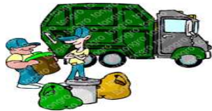
[ 8톤 트럭 1400대 ]